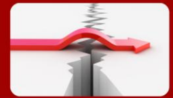
GRÁFICO DE PROCESO